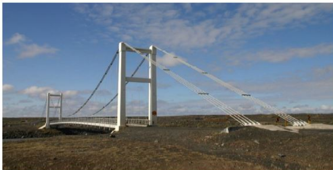
Island - Brücke Jökulsá á Fjöllum im Zuge der Ring Road