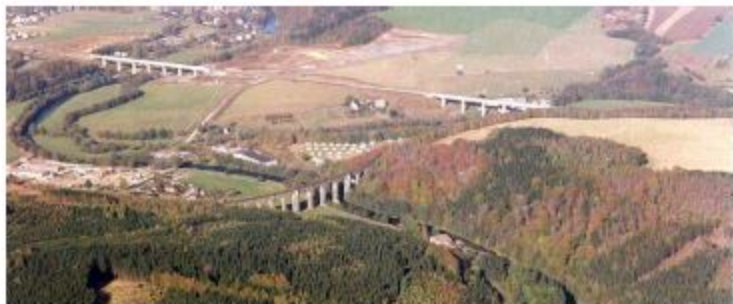
Eisenbahnstrecke Dresden - Chemnitz

im Vordergrund: Altes Viadukt über die Flöha - im Hintergrund: Streckenneubau mit 2 Brücken