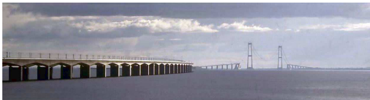
Brücke über den Großen Belt während der Bauzeit

Druck Michael Hofmann Buchenweg 26 35321 Laubach Tel. 06405-3484 meikrosihofmann@t-online.de