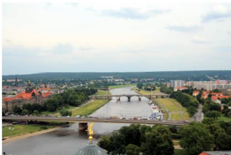
Dresdner Brücken vom Turm der Frauenkirche