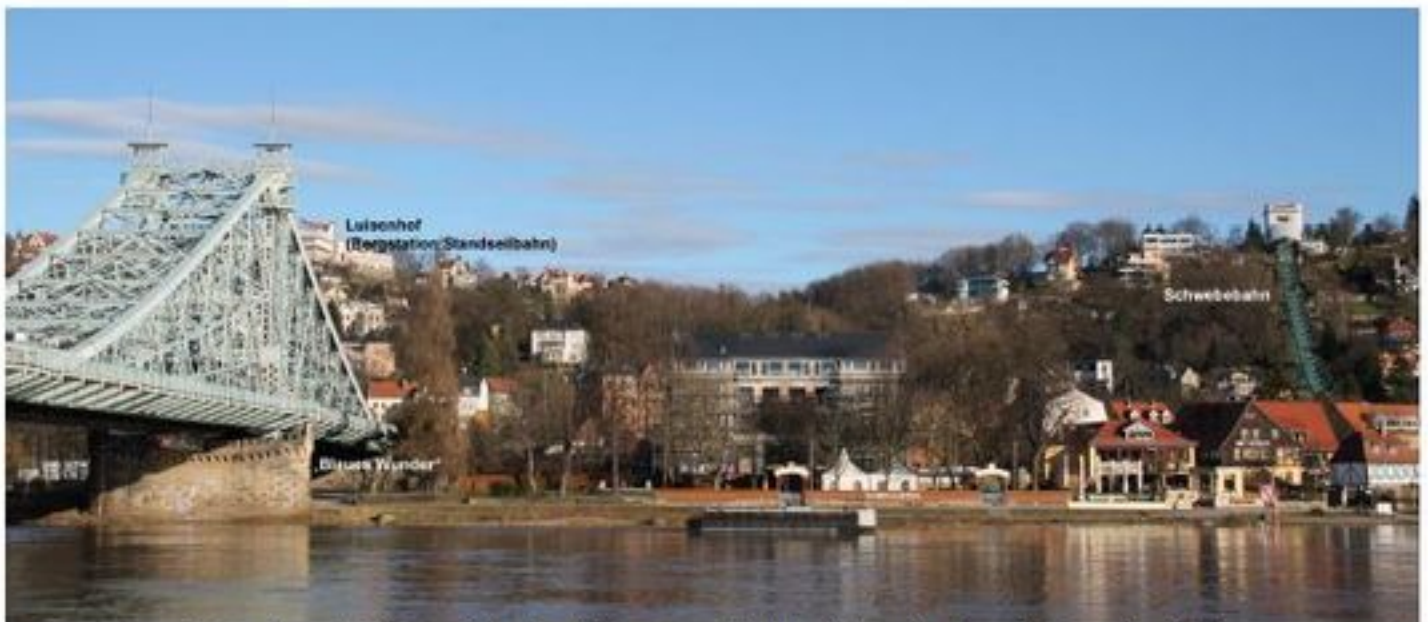
Dresden - "Blaues Wunder", Berggaststätte Luisenhof und Schwebebahn