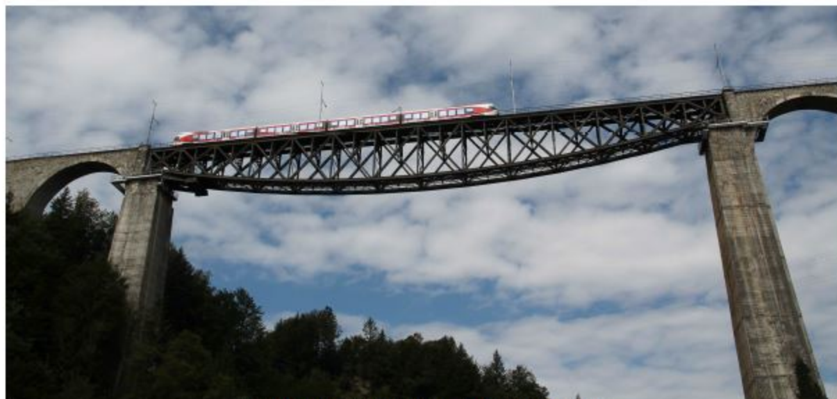
Sitterviadukt der Bodensee - Toggenburg - Bahn

Das 365m lange Viadukt mit seinem 120m langen und 920t schweren Fischbauch-Einhängerträger wurde 1907 - 1910 rund 100m über der Sitter errichtet.