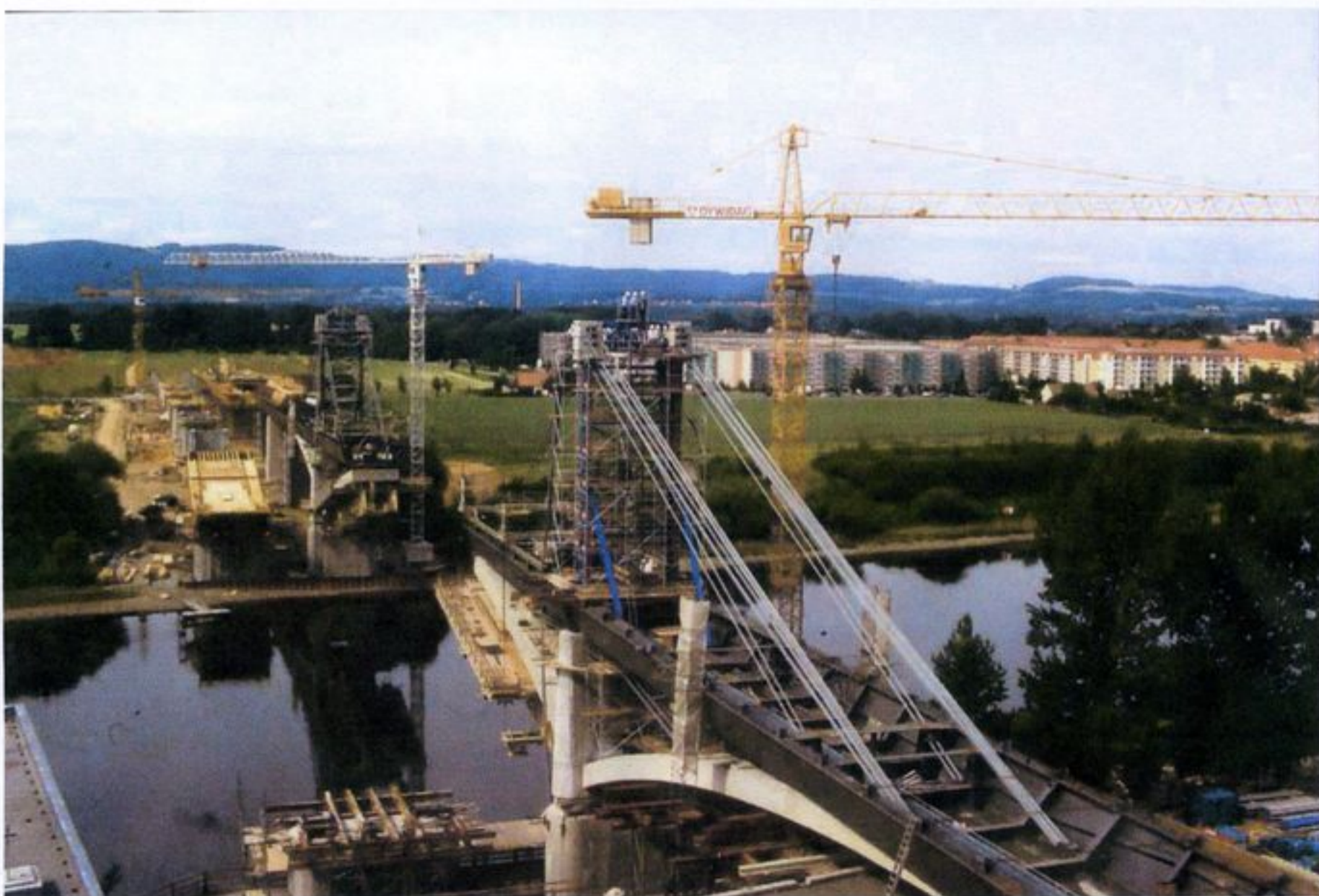
Bau der Sachsenbrücke über die Elbe in Pirna (1999)