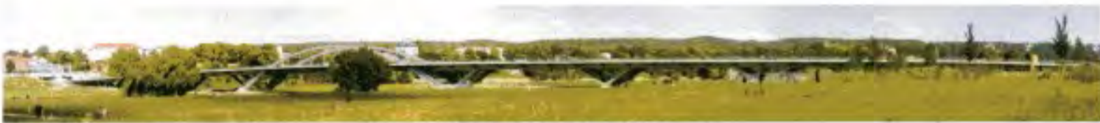
Waldschlößchenbrücke in Dresden