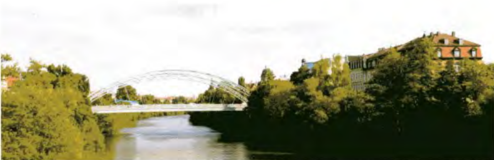
Luitpoldbrücke in Bamberg