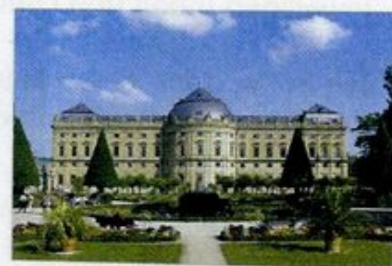
Würzburg Residenz und Hofgarten UNESCO Weltkulturerbe