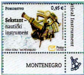
Montenegro MiNr. 455 (2020)

Die nautischen 4 Inch-Sextanten wurden vermutlich von der Firma Kelvin & Hughes London ca. 1917 gefertigt. Sie ging aus mehreren Firmenzusammenschlüssen im 19. Jahrhundert hervor. Ein Ursprung lässt sich auf die Uhrmacherfamilie Hughes zurückführen. Die andere Wurzel ist mit William Thomson (Lord Kelvin) verknüpft, der für die Entwicklung von Messinstrumenten bekannt ist. Auf dem Messingschild unter der Wertstufe ist eine große Krone erkennbar, was auf ein königliches Privileg schließen lässt. Der Kleinbogen mit 8 Marken + Zierfeld ist mit diversen Hinweisen auf dem Bogenrand versehen.