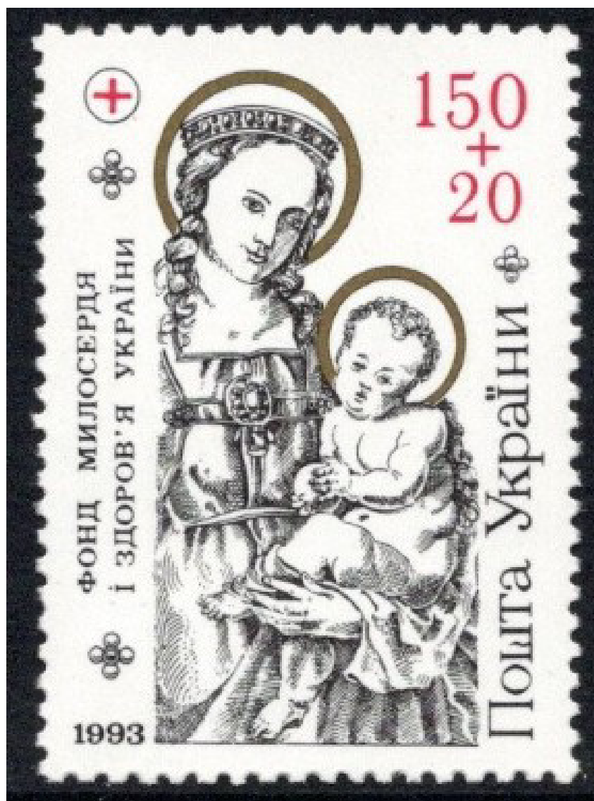
Albrecht Dürer, Maria mit Kind, Kohlezeichnung ca. 1514 Briefmarke Ukraine, erschienen am 15. Januar 1994

In diesem Heft: Protokoll zur Mitgliederversammlung 2022 in Coburg