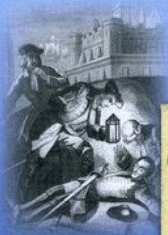
Schwedenkönig Karl XII stirbt durch eine feindliche Gewehrkugel bei der Belagerung von Frederikshald 1718