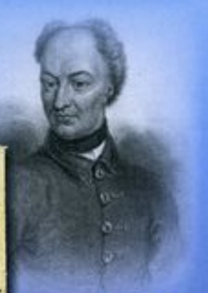
König Karl XII, König von Schweden

Riga 1708: Brief aus der schwedischen Zeit Lettlands mit sehr seltenem Banderolenstempel ‚RIGA‘ an den Karl XII, König von Schweden. Nahezu während der gesamten Regentschaft von Karl XII tobte der ‚Große Nordische Krieg‘ (1700-1721) um die Vorherrschaft im Ostseeraum. Schwedenkönig Karl XII starb bei der Belagerung von Frederikshald im Jahr 1718. Sein Tod leitete das Kriegsende ein, in dessen Folge Schweden für immer seine Großmachtposition in Europa verlor. Im Frieden von Nystad 1721 wurde Lettland von Schweden abgetrennt und als russische Provinz dem Zarenreich zugeschlagen.