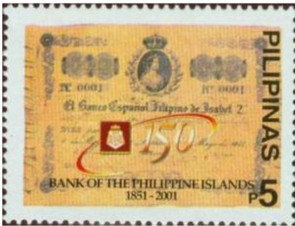
Philippinen 2001–Michel Nr. 3228

Wichtige Wettbewerber auf den Philippinen sind die "Bank of the Philippine Islands" (BPI).